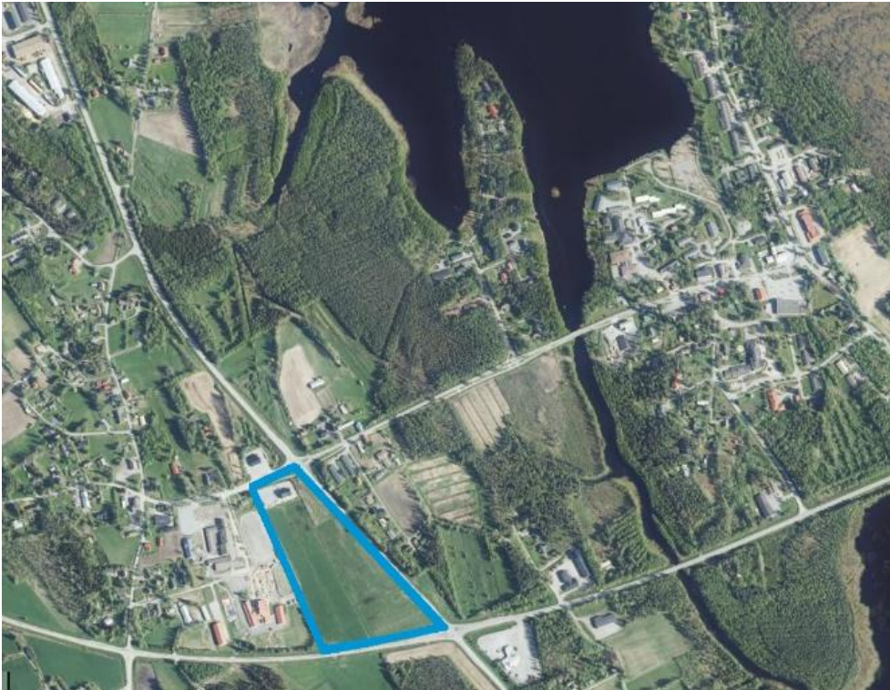
Kuva 1. Alustava kaava-alueen rajaus esitettyä sinisellä viivalla.

Suunnittelualue sijaitsee Evijärven kunnassa noin kilometrin päässä kunnan keskustasta länteen. Alue on kooltaan noin 7 hehtaaria.