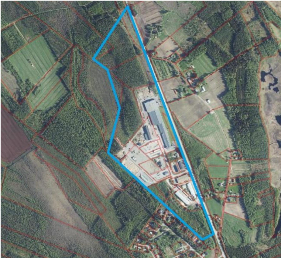
Kuva 1. Alustava suunnittelualueen rajaus.

Suunnittelualue sijaitsee Evijärven kunnassa noin 1,5 kilometrin päässä kunnan keskustasta. Alue on kooltaan noin 30 hehtaaria.